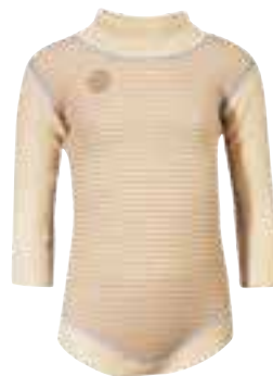
CLASSIC BABY BOY Body

Str 0 år: 3203002/Str 0,5 år: 3203102 Str 1 år: 3203202