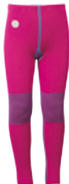
CLASSIC STRIPES CERISE Tights

Str 3 år: 3202401/Str 4 år: 3202501 Str 6 år: 3202601/Str 8 år: 3202701