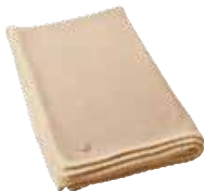
CLASSIC BABY Natural 3204002

Myke tepper som matcher klærne. Målet på teppene er ca 95 x 115 cm.