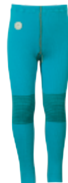
CLASSIC STRIPES TURQUOISE Tights

Str 0 år: 3201004/Str 0,5 år: 3201104/Str 1 år: 3201204 Str 2 år: 3201304/Str 3 år: 3201404/Str 4 år: 3201504 Str 6 år: 3201604/Str 8 år: 3201704