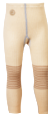
CLASSIC BABY BOY Tights

Str 0 år: 3201002/Str 0,5 år: 3201102 Str 1 år: 3201202