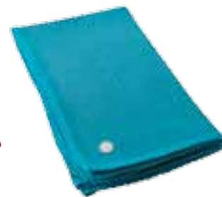
CLASSIC BABY Turquoise 3204001