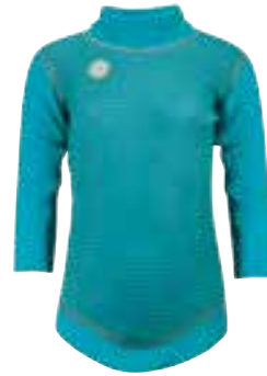
CLASSIC STRIPES TURQUOISE Body

Str 0 år: 3203004/Str 0,5 år: 3203104 Str 1 år: 3203204/Str 2 år: 3203304