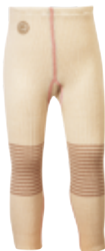
CLASSIC BABY GIRL Tights

Str 0 år: 3203003/Str 0,5 år: 3203103 Str 1 år: 3203203