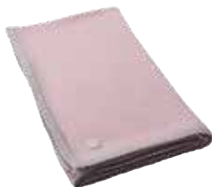
CLASSIC BABY Pink/Grey 3204005