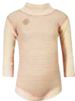
CLASSIC BABY GIRL Body

ettersom barnet vokser. Tights finnes i str 0-1 år. Den har kile til ekstra plass for bleie. Den er høy i livet og har åpning for justering av strikk. Tights har ekstra lengde på bena som kan brettes ned ettersom barnet vokser.