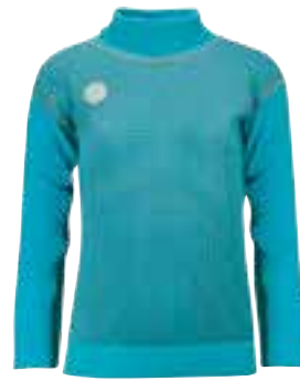
CLASSIC STRIPES TURQUOISE Genser

Str 3 år: 3202404/Str 4 år: 3202504 Str 6 år: 3202604/Str 8 år: 3202704