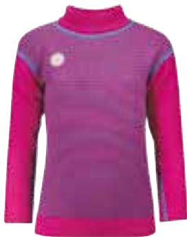
CLASSIC STRIPES CERISE Genser

Str 0 år: 3203001/Str 0,5 år: 3203101 Str 1 år: 3203201/Str 2 år: 3203301