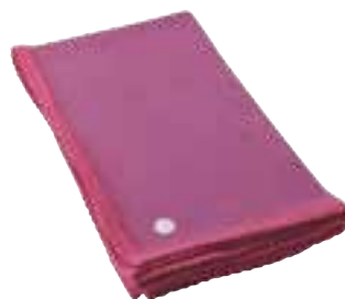
CLASSIC BABY Cerise 3204004