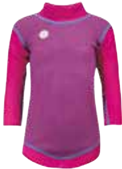
CLASSIC STRIPES CERISE Body

ing av strikk. Tights har ekstra lengde på bena som kan brettes ned ettersom barnet vokser. Tights i str 3-8 år har enkel søm foran og bak for beste tilpasning til barnets passform. Tights har ekstra lengde på bena som kan brettes ned ettersom barnet vokser, og har åpning for justering av strikk.